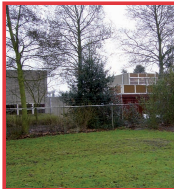
Door hoge bosschages geen sociale controle door omwonenden mogelijk.

verlichting, speelgelegenheden, straatmeubilair en verkeer samen met de school en de wijkagent risicovolle situaties geïnventariseerd. De resultaten van de schouwen zijn besproken op de eerstvolgende werkvergadering op 9 april. Aan de hand van die resultaten worden concrete acties of maatregelen uitgevoerd. In de volgende nieuwsbrief gaan we hier verder op in.