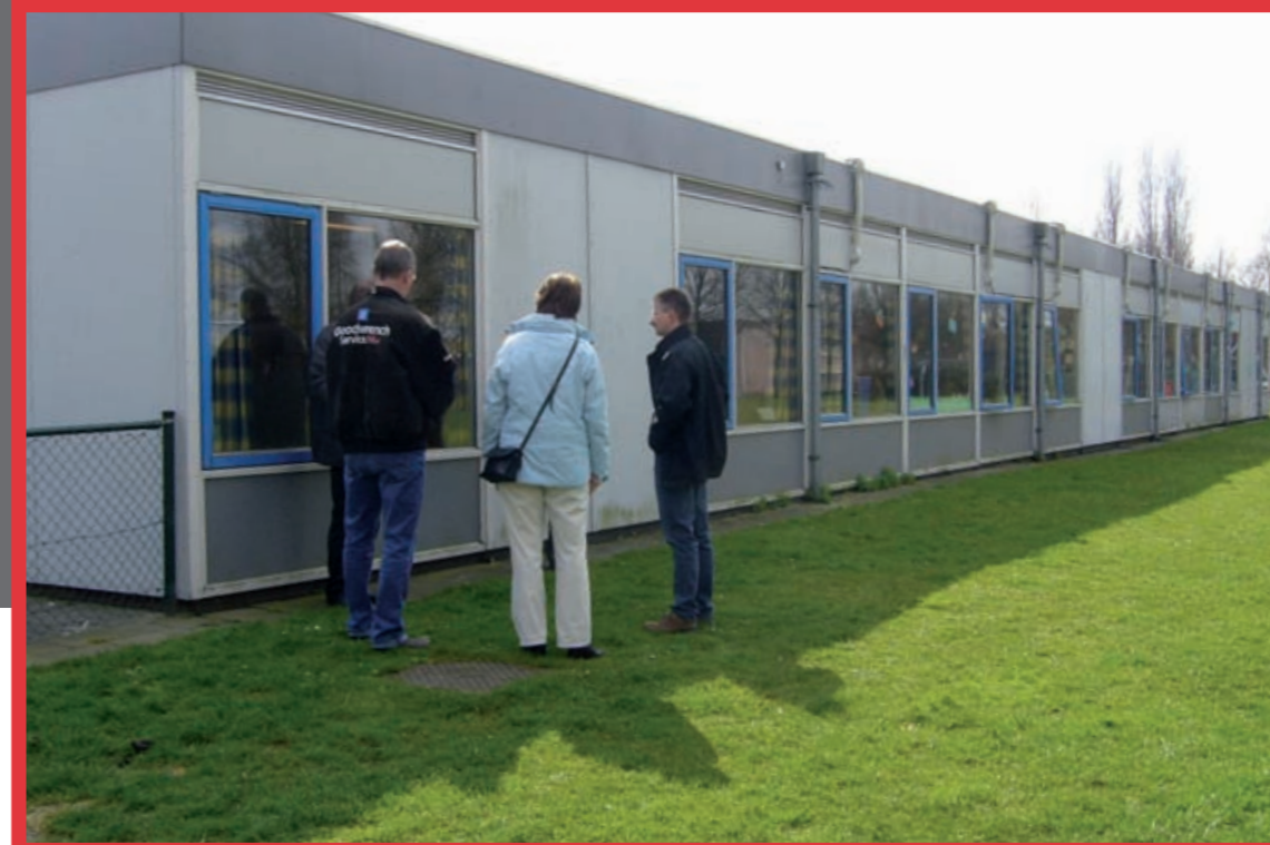
De wijze waarop airco's (en hemelwaterafvoeren) zijn aangebracht nodigt uit tot vernielen en opklimmen.

Na de startbijeenkomst op 15 januari, waarover u wellicht in de krant heeft kunnen lezen of op TV 10 heeft gezien, vond op 12 maart de eerste werkgroepvergadering plaats. Al snel werd duidelijk dat een schouw bij de scholen gewenst was. In de drie afzonderlijke schouwen die op 24, 26 en 30 maart gehouden zijn, hebben gemeentelijke deskundigen op het gebied van groen, grijs,