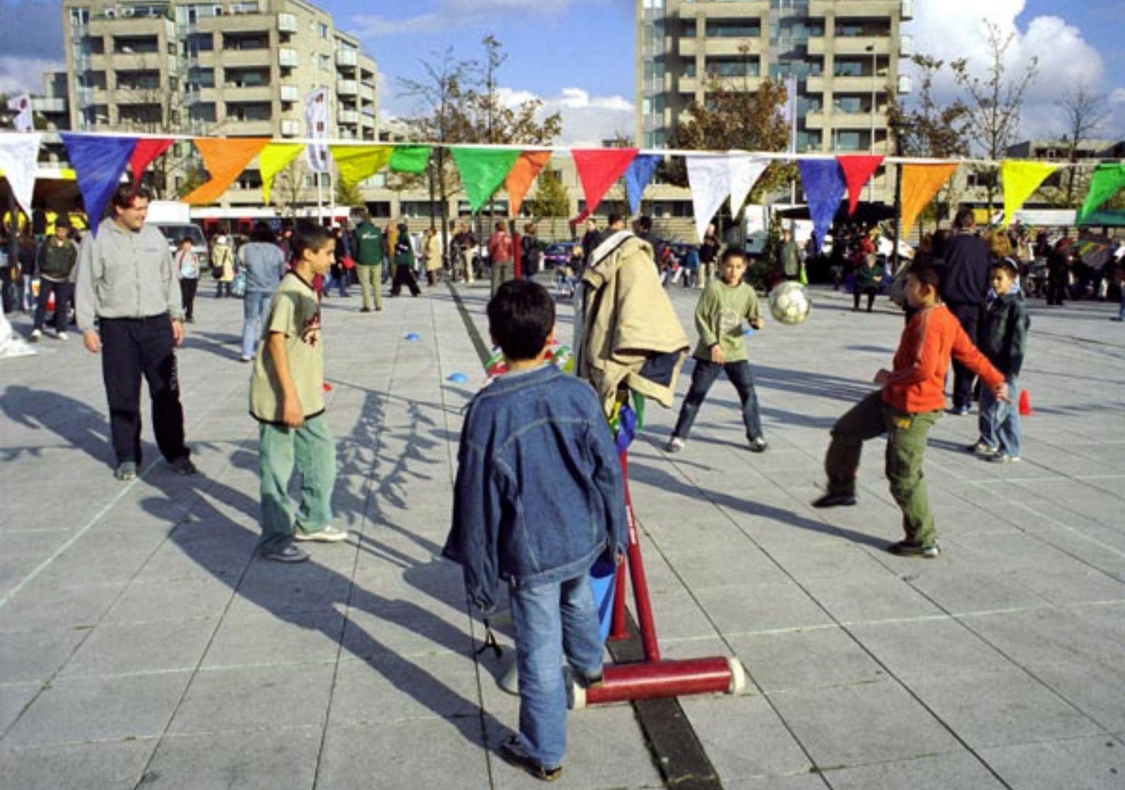
Straatfeest in Amsterdam-West

Het zit volgens Bekker ook in de programma's zelf: "We hebben een set programma's geselecteerd die zichzelf hebben bewezen. We hoeven niet steeds opnieuw een brede waaier van programma's te bekijken." Bekker benadrukt dat het geen automatismen zijn: "Jongere A heeft problematiek B en gaat dus naar programma C. Zo werkt het natuurlijk niet. De set evidence based programma's is een prachtig hulpmiddel. Maar meer ook niet, het zijn uiteindelijk de hulpverleners die beslissen."