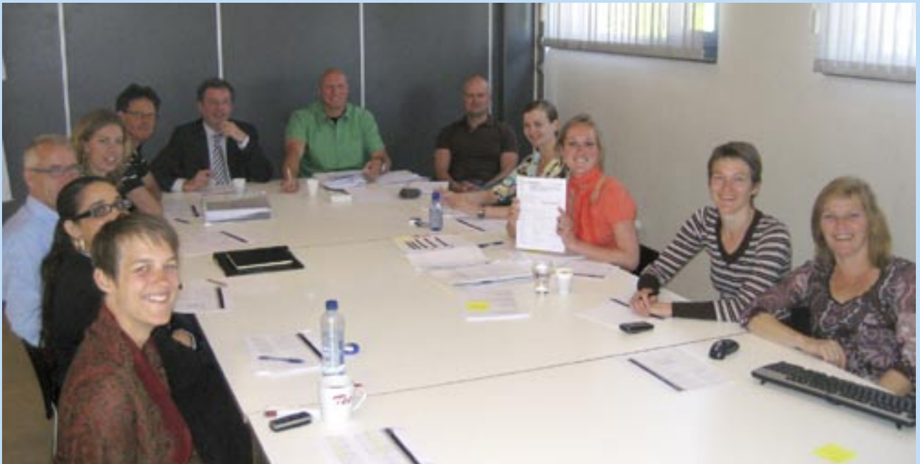
Het Openbaar Ministerie, de Raad voor de Kinderbescherming, Bureau Jeugdzorg Agglomeratie Amsterdam, Bureau Halt, het stadsdeel Amsterdam-West en de Ketenuit nemen deel aan de pilot.

van Duijn van de directie Openbare Orde en Veiligheid van de gemeente Amsterdam: “Jongeren die gepokt en gemazeld zijn in het criminele milieu, daar valt over het algemeen weinig eer aan te behalen. Jongeren die op het randje balanceren, kun je veel gemakkelijker bijsturen. Natuurlijk, voor het overgrote deel van die first offenders blijft het bij die eerste keer, maar als we kunnen voorkomen dat die overige tien of twintig procent afglijdt, dan hebben we veel bereikt.”